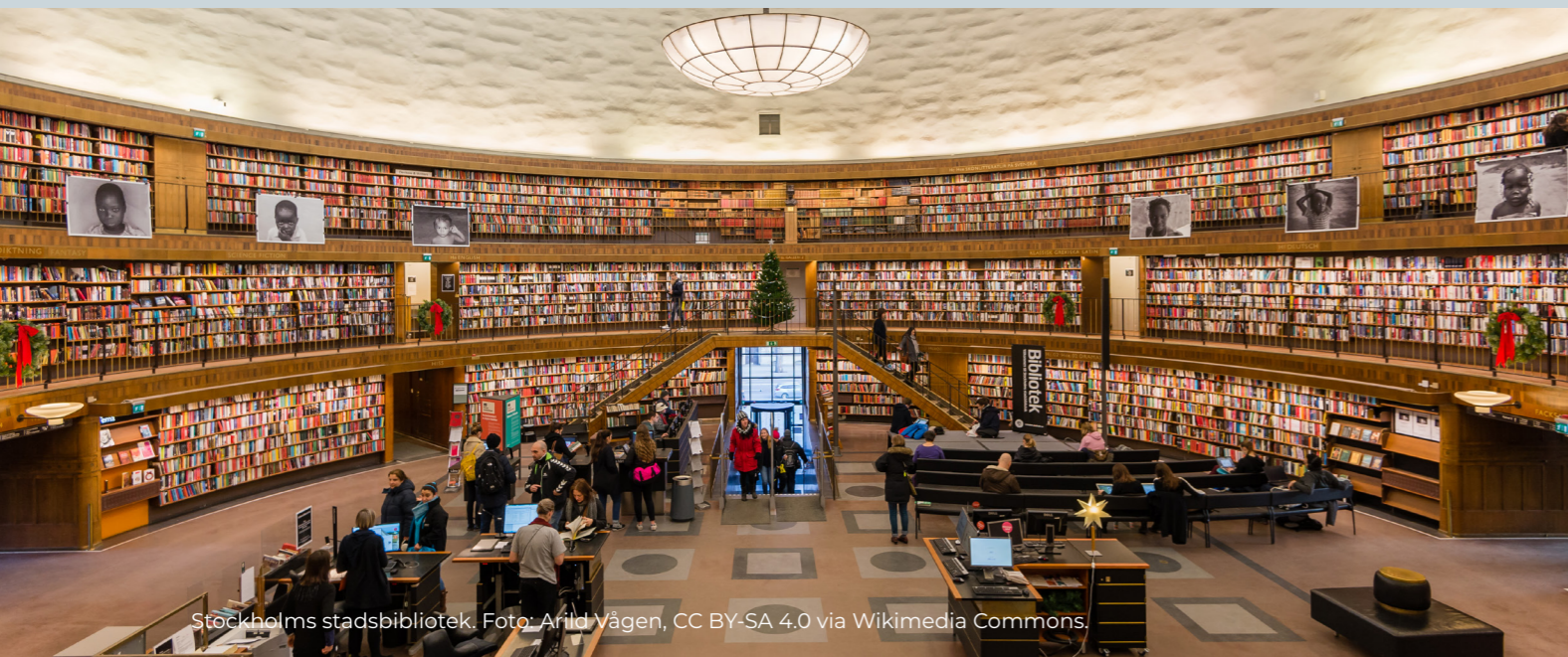
Stockholms stadsbibliotek.

Kunskap växer när den delas. Tack vare dig kan framtida generationer fortsätta att lära, förstå och skapa – fritt.